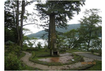
（りつ子ブログから）